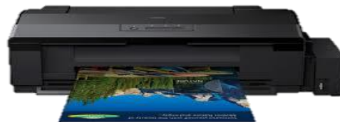
EPSON TABLOIDE L1300